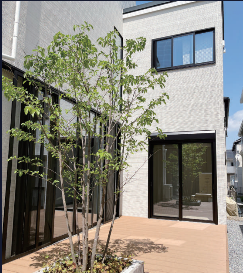
グランビュネ高柳ガーデン3号棟